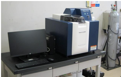
図 1 蛍光 X 線分析装置

当試験場では令和 2 年度に卓上型蛍光 X 線分析装置 RIGAKU supermini200 を導入しました（図 1）。